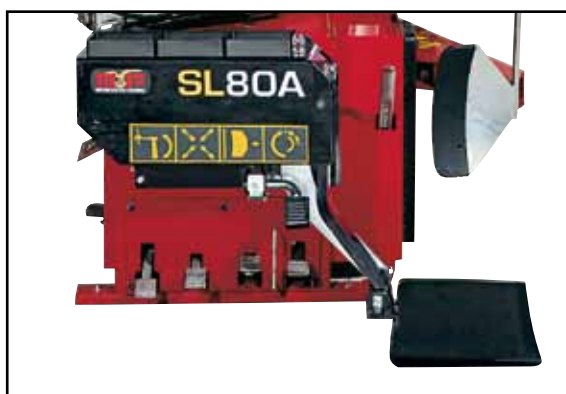
B. SL80 A -> 8-11100292 Sollevatore ruota / Wheel lifter

www.facebook.com/MONDOLFOFERROspa http://www.youtube.com/user/MondolfoFerro